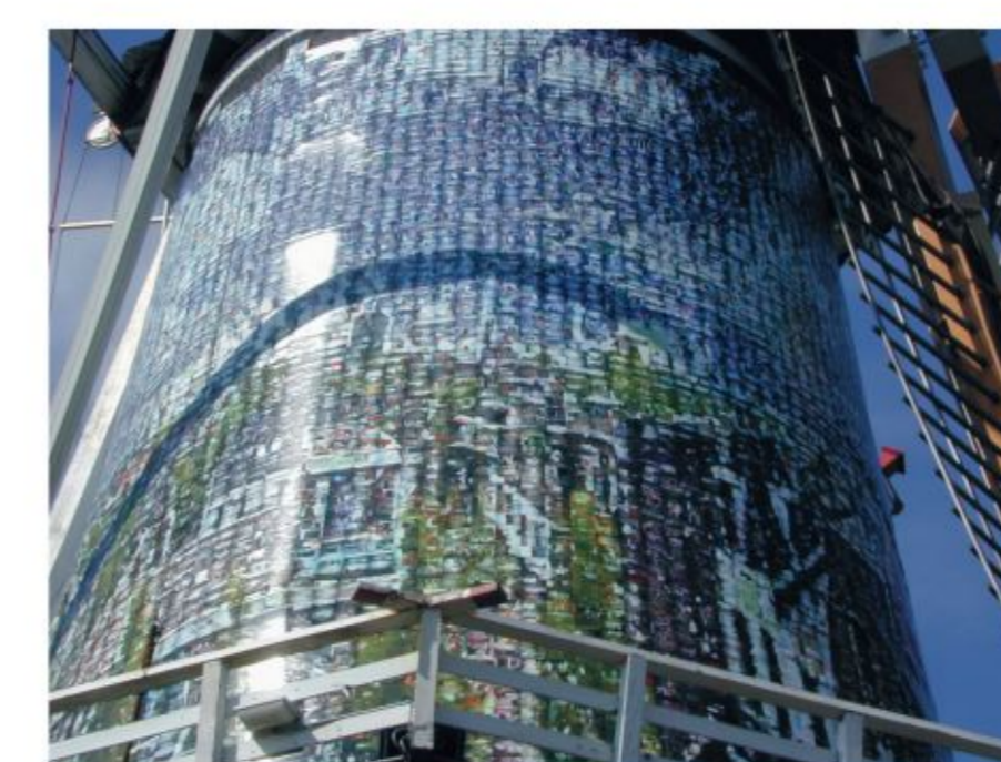
Molen van Klarendal, Arnhem