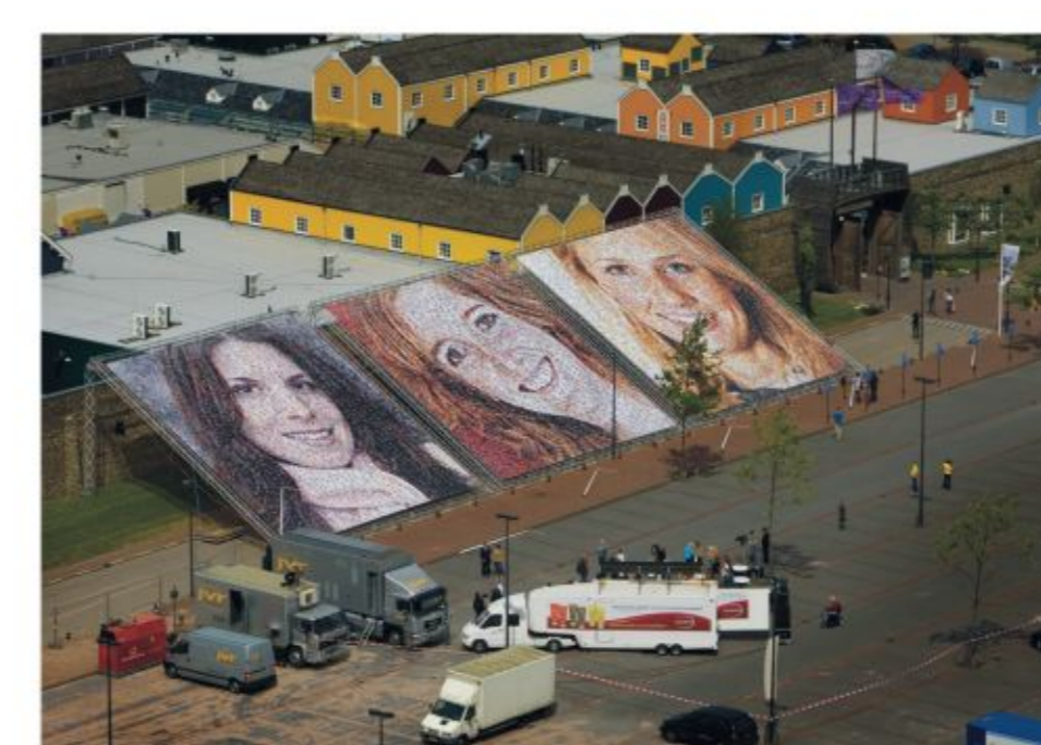
Reclame Andrélon, Lelystad