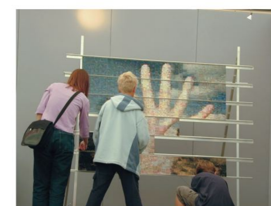
Handpuzzel, Schoorlse Kunsten