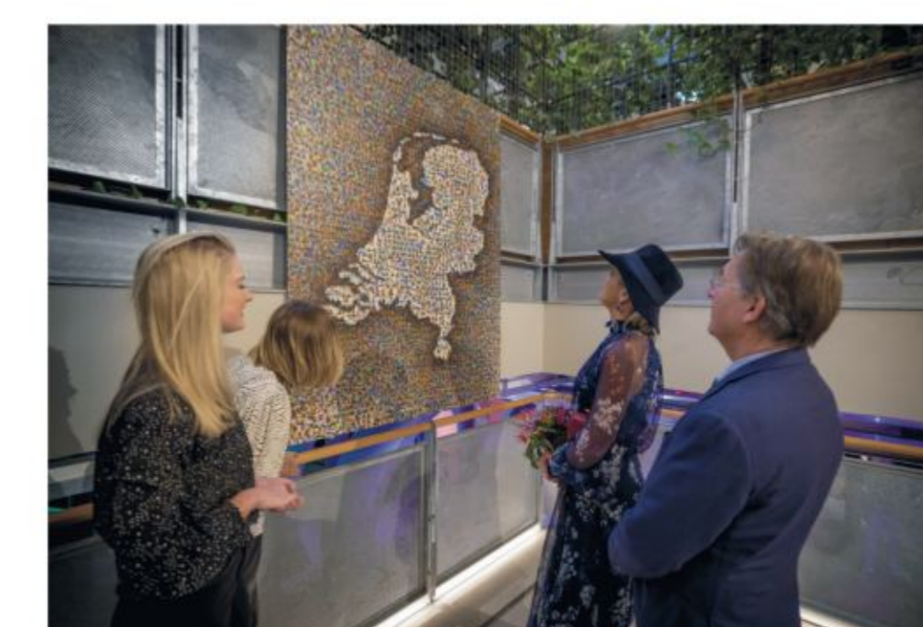
Portret van Nederland, NEMO